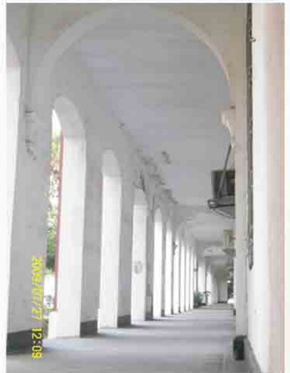
長長的走廊加上斑駁的牆身使成大更有味道。

我第一份工作是馬來西亞學姐介紹的，她告訴系主任我需要工作，系主任聽到我的情況，找我加入研究團隊當個打字員。除了打字外，也幫教授整理口述歷史字稿。聽老人家講故事，二戰時期走難、讀書的情況。這要了我半條命，台灣老一輩，除了國語、台語、還常講日文，教授有留德留英，專業名詞一大堆。可是如果沒有替教授工作，很可能要像其他同學一樣，去餐廳打工。我有些同學在海鮮餐廳打工，傍晚6時上班，12時打烊，1時多下班，回宿舍已近凌晨，明日還要上課，何來精神衝成績，拼獎學金？學業，變成打工一般，能應付過去就算了！