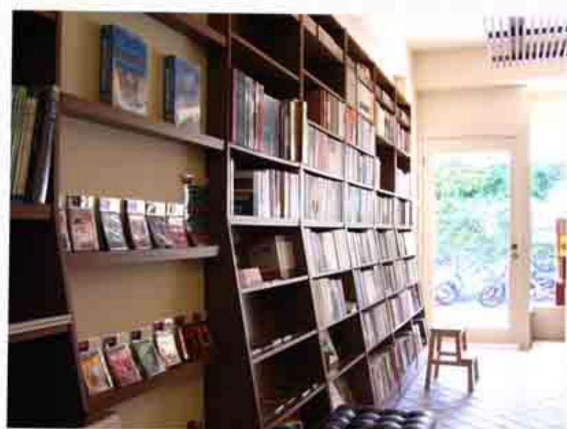
子房兼職的結構群書店，店內擺設很有書香味。