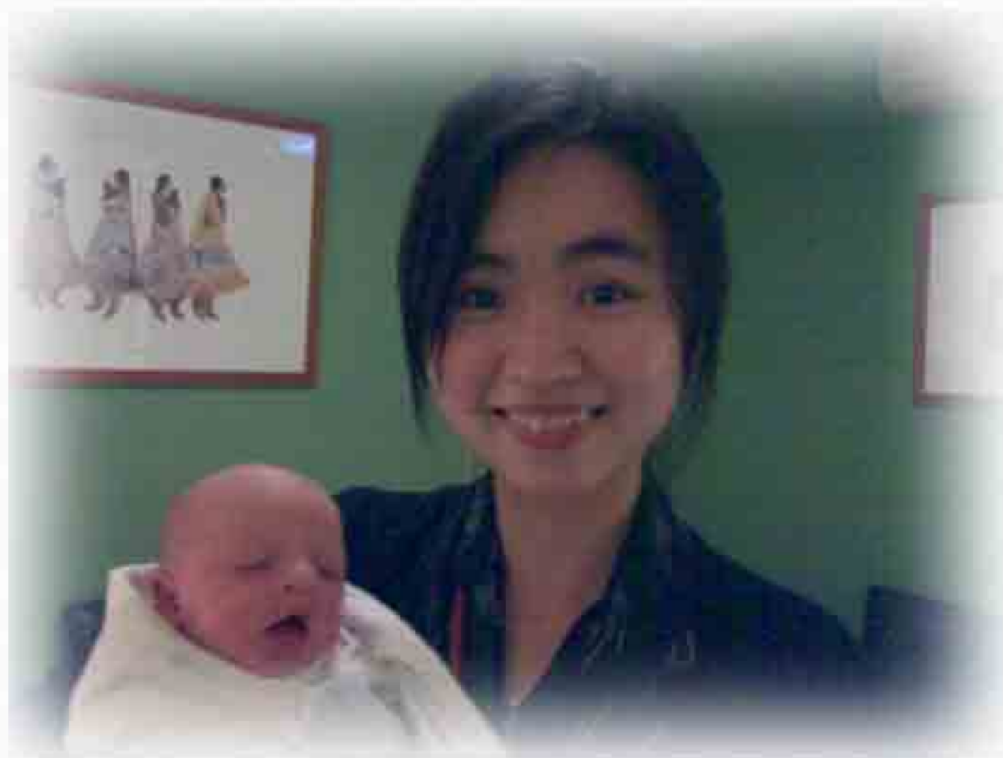
大學時在醫院嬰兒科做兼職

而以布里斯本來講，當地人比較純樸，可以分為兩種人，一種是『聰明人』，一種是『懶人』，聰明人是他們懂得用腦工作，也很明顯發現，他們比較能夠接受亞洲的文化。而以鄭同學多次和澳洲人的工作和學習經驗，部份人很喜歡偷懶，會借故把工作推給中國人。他們也很懂得以笑帶過一切，不管他們喜不喜歡你，不管他們剛剛有沒有在你背後說你不是。